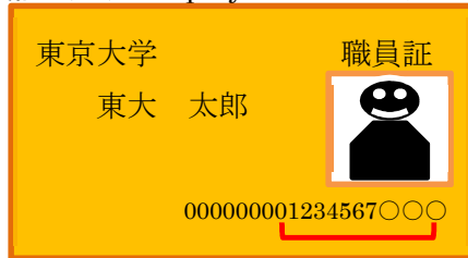
職員証 (旧) Employee ID card (old-style)